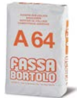
A 64 Rasante edile a base di calce e cemento bianco