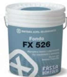
FX 526 Fondo di ancoraggio pigmentato universale