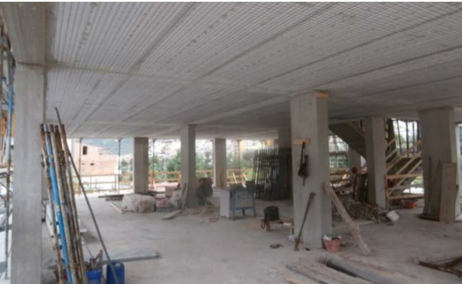
I solai in calcestruzzo armato con pannelli di polistirolo

La sopraelevazione del fabbricato è stata realizzata con pilastri, travi e scala interna in calcestruzzo armato, mentre i solai, tamponamento esterno e tramezzi interni con pannelli antisismici armati in polistirolo; la realizzazione degli intonaci dei solai, tamponamenti interni ed esterni sono stati realizzati utilizzando i prodotti del SISTEMA INTEGRATO FASSA BORTOLO . Questa particolare tipologia costruttiva presenta dei particolari vantaggi in termini di antisismica, resistenza al fuoco, isolamento termico-acustico e velocità di esecuzione.