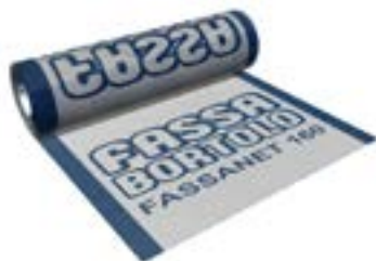
FASSANET 160 Rete di armatura da 160 g/m 2 in fibra di vetro alcali-resistente