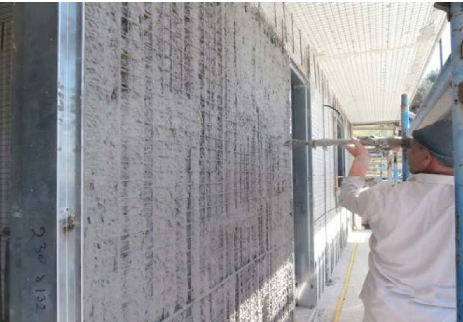
Intonacatura dei pannelli con RR 32

Una volta terminata la costruzione dei solai e murature di tamponamento, è stato applicato il prodotto RR 32 su tutte le superfici murarie rivestite con polistirolo. Il prodotto è specifico per l'intonacatura di questo tipo di materiali ed è facilmente applicabile a spruzzo con macchina intonacatrice. La finitura a civile è stata realizzata con il prodotto A 64 interponendo la rete in fibra di vetro alcali-resistente FASSANET 160 tra la prima e seconda mano.