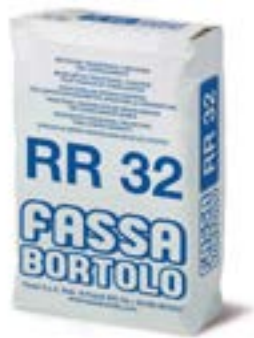
RR 32 Malta cementizia per il trattamento di versanti e per l'intonacatura di murature di pannelli in polistirolo e cemento cellulare