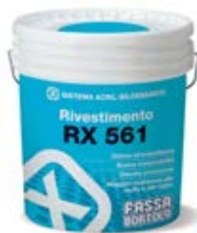
RX 561 Rivestimento acril-silossanico rustico