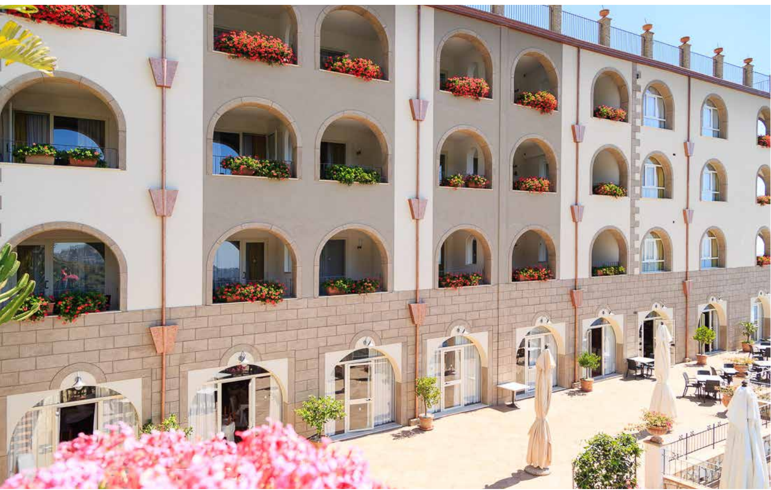
Esterno Hotel Olimpo - Le Terrazze

Dopodiché la rasatura delle superfici risultanti è stata effettuata con il collante edile a base cementizia A 96 . Il prodotto va utilizzato interponendo la rete in fibra di vetro alcali-resistente FASSANET 160 tra la prima e seconda mano. A maturazione avvenuta della rasatura è stato applicato il fondo di ancoraggio pigmentato universale FX 526 seguito dal rivestimento acril-silossanico rustico RX 561 .