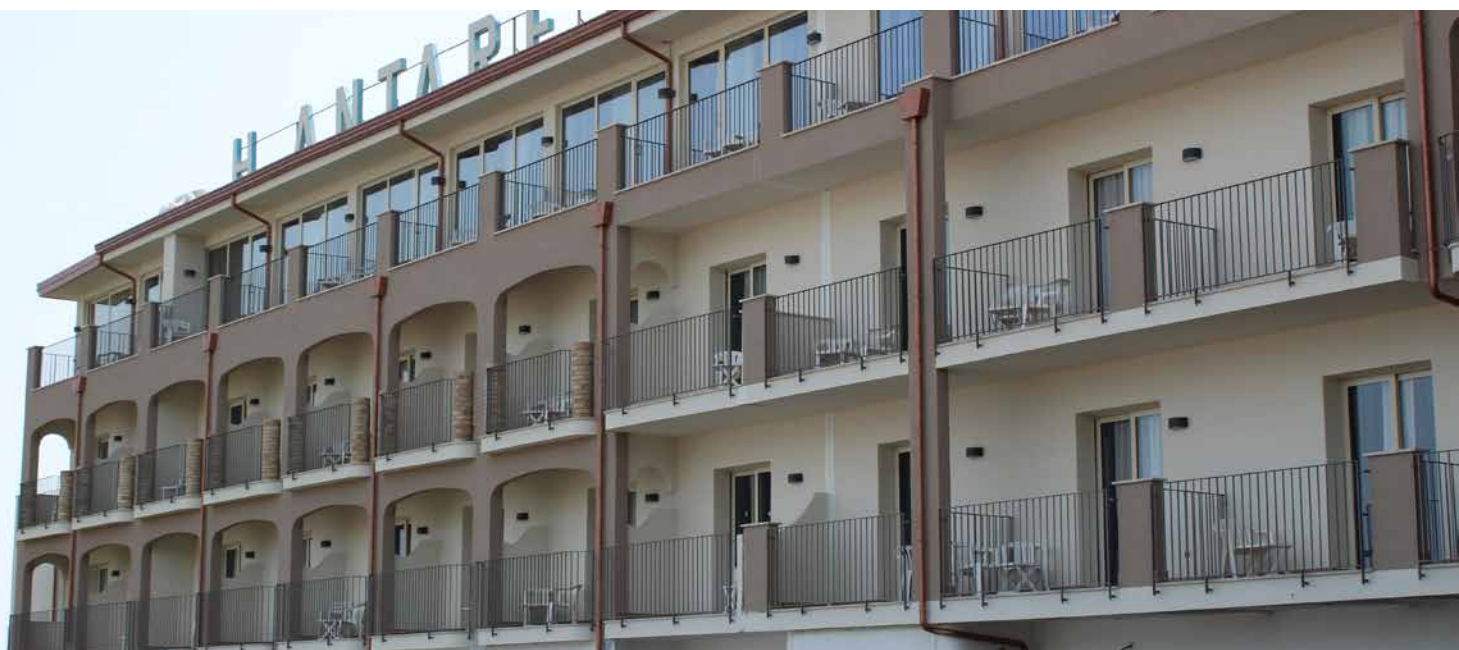
Sopra: Hotel Antares, sotto: Hotel Olimpo - Le Terrazze

Nell'anno 2017 diversi prodotti del SISTEMA INTEGRATO FASSA BORTOLO sono stati protagonisti dei lavori di ripristino e rifacimento delle facciate di entrambi gli hotel. Nello specifico, le zone delle superfici esterne in calcestruzzo che si presentavano particolarmente danneggiate sono state asportate e i ferri di armatura a vista sono stati puliti e trattati con la boiaccia protettiva FASSAFER MONO . I volumi di muratura asportati sono stati ricostruiti con SPECIAL WALL B 550 M , malta monocomponente, contenente cemento, fibrorinforzata, solfato resistente e a ritiro controllato per la riparazione e rinforzo di strutture murarie e in calcestruzzo.