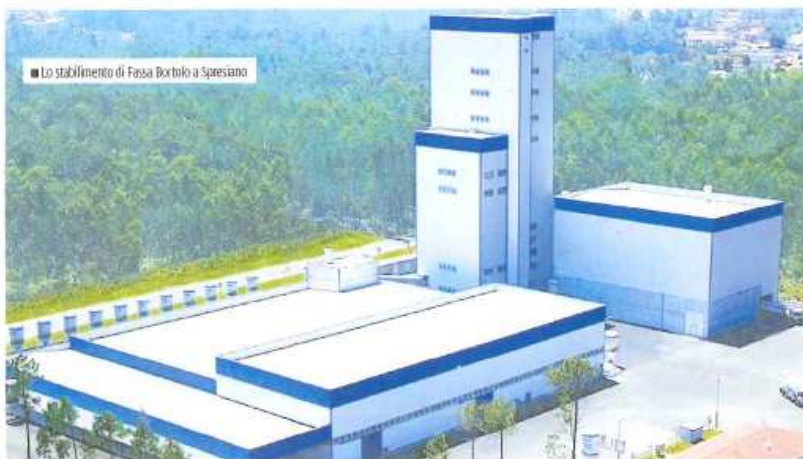
Lo stabilimento di Fassa Bortolo a Spresiano