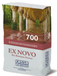
INTONACO 700 Bio-intonaco di finitura a base di calce idraulica naturale NHL 3,5 per il risanamento di murature umide ad effetto marmorino per interni ed esterni.