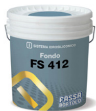
FS 412 Fissativo per cicli idrosiliconici.