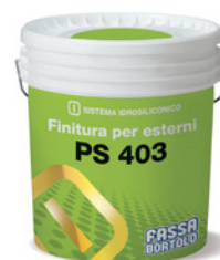
PS 403 Finitura altamente traspirante.