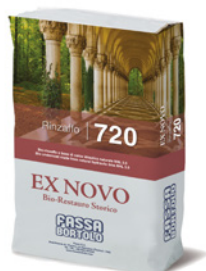
RINZAFFO 720 Bio-rinzafo a base di calce idraulica naturale NHL 3,5 per il risanamento di murature umide per interni ed esterni.