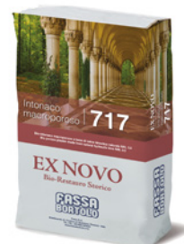
INTONACO MACROPOROSO 717 Bio-intonaco di fondo a base di calce idraulica naturale NHL 3,5 per il risanamento di murature umide per interni ed esterni.