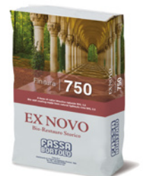
FINITURA 750 Bio-intonaco di finitura a base di calce idraulica naturale NHL 3,5 per il risanamento di murature umide ad effetto marmorino per interni ed esterni.