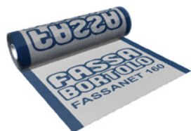
FASSANET 160 Rete di armatura da 160 g/m 2 in fibra di vetro alcali-resistente.