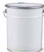
Secchi per miscelazione