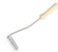
Rullino a pelo corto