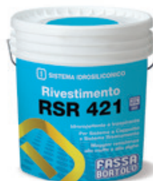
RSR 421 Rivestimento idrosiliconico rustico