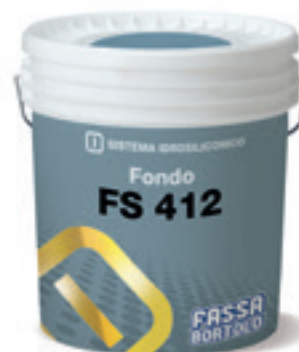
FS 412 Fissativo per cicli idrosiliconici