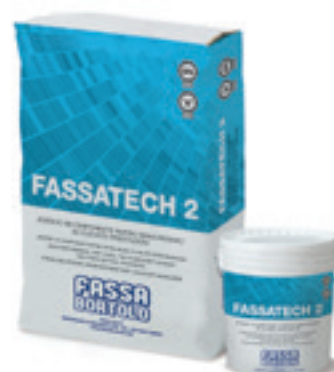
FASSATECH 2 Adesivo cementizio extra-bianco e grigio, rapido, antiscivolo, a tempo aperto allungato, altamente deformabile