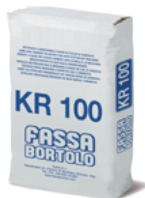
KR 100 Intonaco di fondo a base di calce e cemento, con elevate resistenze meccaniche, per esterni ed interni