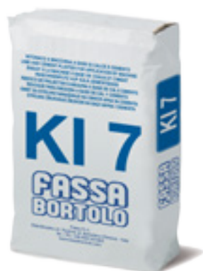
KI 7 Intonaco di fondo fibrorinforzato, con idrorepellente, a base di calce e cemento, per esterni ed interni