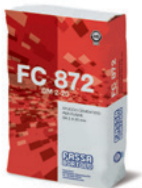
FC 872 GM 2-20 Sigillante in polvere, resistente a muffe e alghe, idrofugato, fibrato, per fughe da 2-20 mm, per interni ed esterni