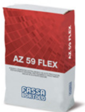
AZ 59 FLEX Superadesivo monocomponente a buona elasticità, bianco e grigio, per pavimenti e rivestimenti in interni ed esterni