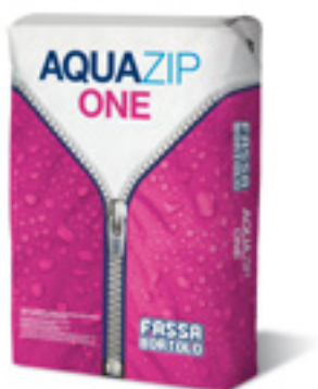
AQUAZIP ONE Guaina elastica cementizia monocomponente impermeabilizzante, applicabile a spatola, rullo e pennello