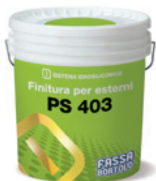
PS 403 Finitura altamente traspirante