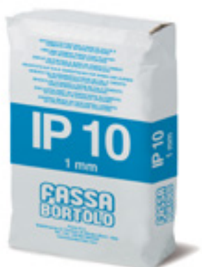
IP 10 Intonaco di finitura a base di calce e cemento per esterni ed interni