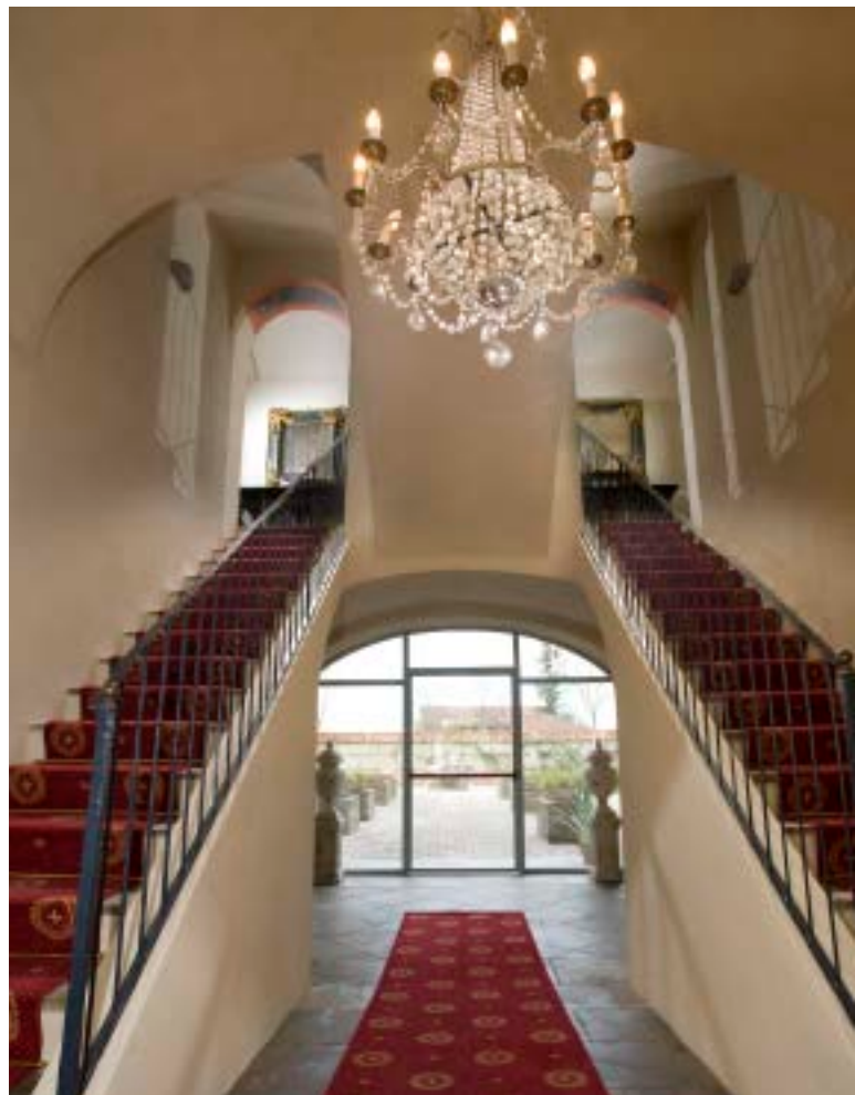
Scalinate d'ingresso e bagni di una camera